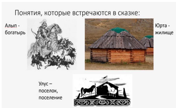
Рисунок 2. Пример слайда с объяснением понятий

Обсуждение сказки имеет смысл предварить ее прочтением педагогом, разъяснением неизвестных для обучающихся слов: например, алып, юрта, улус. Для этого на доске стоит продемонстрировать слайд (рис. 2), на котором будет объяснение слов, а также следует обратиться к хакасскому словарю [7].